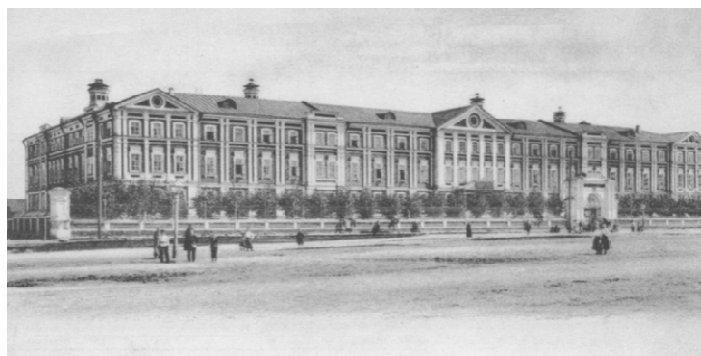
Огромное трёхэтажное здание на 160 квартир для «совершенно немужских вдов», имеющих не менее двоих малолетних (не старше 12 лет) детей. Бесплатное отопление, электрическое освещение, общие кухни, баня, прачечная, а также лазарет и училище – всё изначально было в распоряжении тех, кто там жил.

Разумеется, не все купцы и промышленники дореволюционной России были идеальными, но подавляющее большинство старалось ради своей Родины. Они вкладывали свои честно заработанные деньги в родную землю, в российское производство, помогали, прежде всего, своему народу.