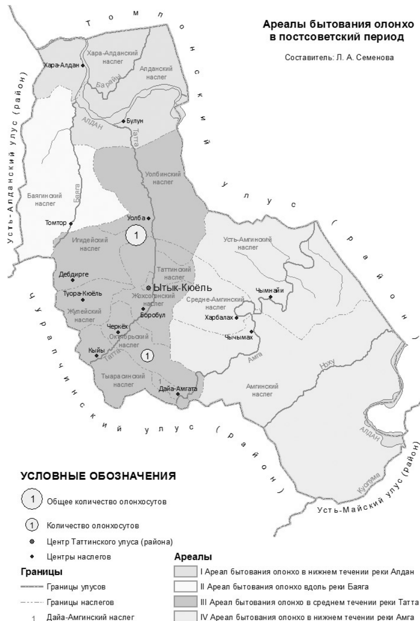
Рис. 5. Ареалы бытования олонхо в постсоветский период (в современных границах наслегов Таттинского района)

Таким образом, для определения бытования олонхо таттинской локальной традиции нами сделана попытка визуализации результатов исследования, где выявлены и показаны ареалы распространения олонхо по трем периодам. В дореволюционный период олонхо активно бытовало в среднем течении Таатта и вдоль реки Баяга, но не имело особого развития в ареалах в нижних течениях рек Алдан и Амга. В советский период олонхо бытовало в Жулейском, Игидейском, Жехсогонском, Тырасинском, Октябрьском, Селляхском, Таттинском, Уолбинском (ареал бытования олонхо в среднем течении реки Таатта), Баягинском (ареал бытования олонхо вдоль реки Баяга) наслегах, но в меньшей степени, чем в дореволюционный период. В Хара-Алданском, Алданском (ареал бытования олонхо в нижнем течении реки Алдан), Усть-Амгинском, Амгинском (ареал бытования олонхо в нижнем течении реки Амга) наслегах олонхо не имело особого развития. Но по сравнению с дореволюционным периодом там отмечено больше олонхосутов, хотя многие из них не развивали сказительское искусство. В постсоветский период ареалом бытования являлся один Октябрьский наслег (ареал бытования олонхо в среднем течении реки Таатта) – родина последнего таттинского олонхосута П. Е. Решетникова – Кёсёнгё Петра.