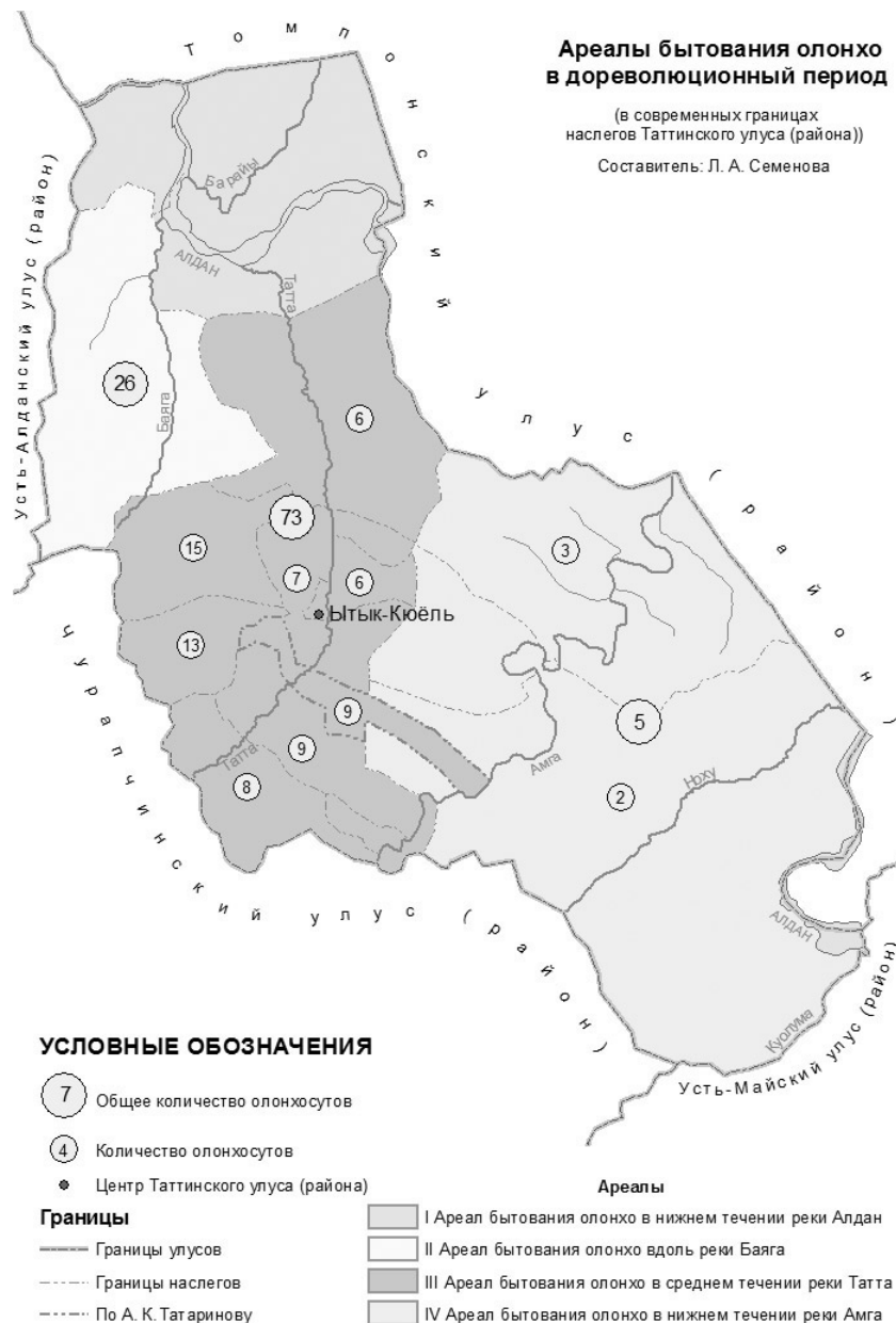
Рис. 3. Ареалы бытования олонхо в дореволюционный период (в современных границах наслегов Таттинского района)

Таким образом, олонхо активно бытовало в местах, расположенных в среднем течении реки Таатта и вдоль реки Баяга. В нижнем течении реки Алдан и в нижнем течении реки Амга оно не имело особого развития.