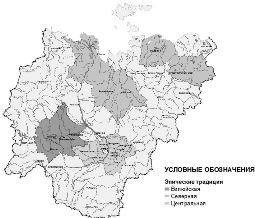
Рис. 1. Эпические традиции якутов (по классификации В. В. Илларионова)

При этом В. В. Илларионов отметил, что отдельные талантливые олонхосуты могли создавать свои «школы», особенности которых наследовались десятками молодых сказителей, тем самым вырабатывалась определенная эпическая традиция. Исследователь также выяснил, что в образовании сказительских «школ» большую роль играла эпическая среда, которая выделяла и поддерживала одаренных олонхосутов.