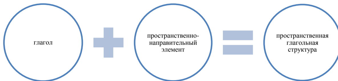
Рис. 1. Пространственная глагольная структура [Там же, с. 69]

Анализ языковых явлений, отражающих пространственные отношения, предполагает сопоставление английских глаголов с послелогом и приставочных глаголов совершенного вида в русском языке с точки зрения когнитивной лингвистики. Представленные группы глаголов образуют особый пласт глагольной лексики в английском и русском языках. При этом выбор данных единиц для исследования обусловлен подобием структурной организации (Рис. 1).