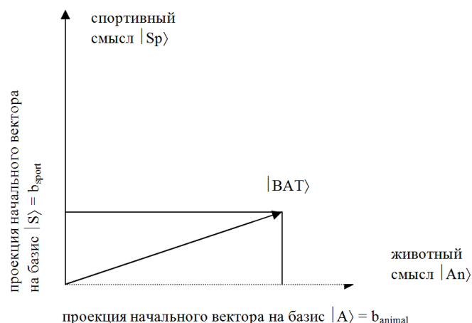
Рис. 1. На схеме представлено 2-мерное собственное пространство, заданное двумя базисными векторами, наблюдаемой A (концепт VAT ), где вектор |VAT\rangle – начальное состояние концепта |\psi\rangle , |An\rangle и |Sp\rangle – собственные векторы. Соответственно, b_{sport} и b_{animal} – собственные значения.

Семантика концепта VAT , таким образом, определяется в плане смыслов, что позволяет в данном случае моделировать смысловое пространство как 2-мерное гильбертово пространство; при этом базисные векторы |Sp\rangle и |An\rangle которого соответствуют двум возможным смыслам («спортивный» и «животный»). Предполагается, что отношения между смыслами таковы, что они являются ортогональными (соответственно, и базисные векторы являются ортогональными).