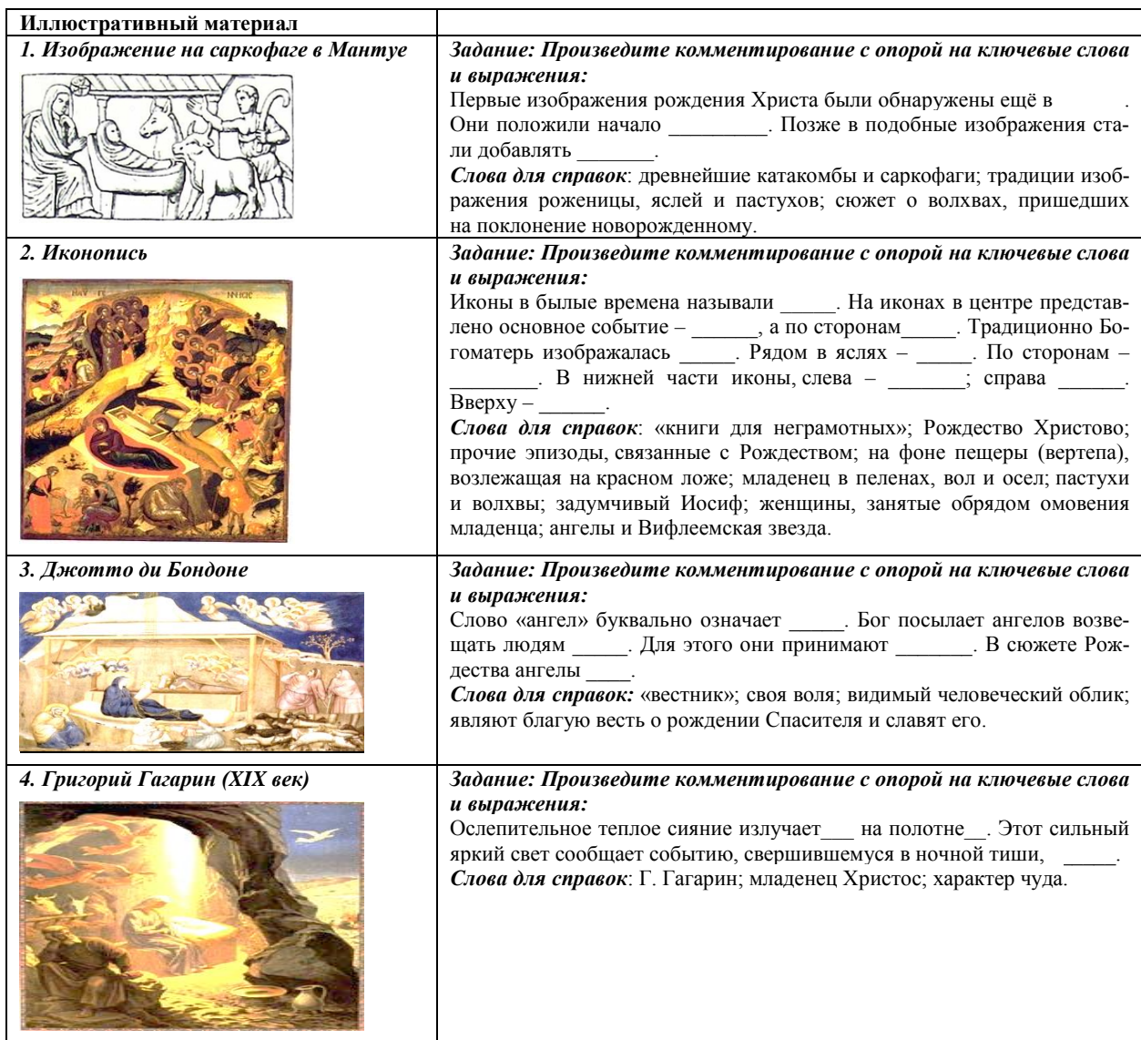
Таблица 1. Дидактический материал для комментирования

Второй этап урока – практическая работа: 1) в толковом словаре определяется лексическое значение существительного «Рождество»; 2) на основе этимологического и историко-культурного анализа выявляется «внутренняя форма» слова; 3) устанавливается смысловая зависимость лексического значения слова и «внутренней» формы концепта «Рождество» на основе словообразовательного анализа. Выделяя ключевые понятия в определениях слова «Рождество», данные в словарях, обучающиеся отвечают на вопрос: какими смыслами оно обогащается согласно статье словаря? (согласно толковому словарю С. И. Ожегова «рождество» – многозначное слово, основное лексическое значение – «христианский праздник», дополнительное – «рождение Христа» [7]. Историко-этимологический словарь: первоначально слово имело значение «рождение», значение «праздник» появилось позднее [8]. Словообразовательный анализ подтверждает проведенное наблюдение: семема «рождество» включена в словообразовательное гнездо доминантного слова «род», образована от слова «родить», имеющего 4 значения: «произвести на свет детеныша или младенца», «дать жизнь кому-нибудь», «дать начало чему-нибудь, создать» (перен.), «приносить урожай» [4]. Благодаря разному роду анализа смысловым стержнем всех ассоциаций, связанных со словом «Рождество», становится прежде всего категория «рождение»).