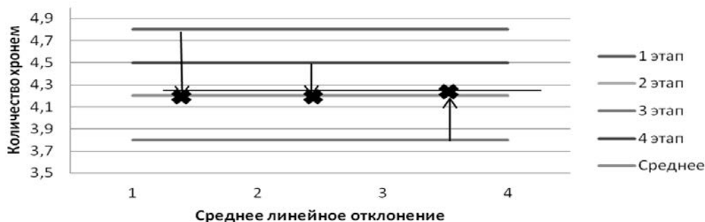
Рисунок 5. Среднее линейное отклонение хронем относительно временных этапов

При среднем значении 4,2 на оси координат это будет выглядеть так (см. Рис. 5).