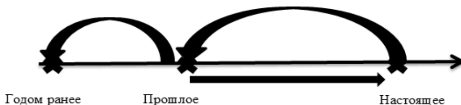
Рисунок 2. Темпоральная модель романа «Ребекка»

Выявленные темпоральные векторы романа позволили определить тип темпоральной модели когнитивной сетки романа. Так как события развиваются не в одном потоке времени, а «скачкообразно», переходя от событий настоящего к событиям прошлого, а из прошлого еще в более далекое прошлое, меняя свое векторное направление, мы с уверенностью можем отнести произведение к линейной многовекторной модели темпоральной архитектоники. Наиболее наглядно событийность романа можно представить в следующей графической темпоральной модели (см. Рис. 2).