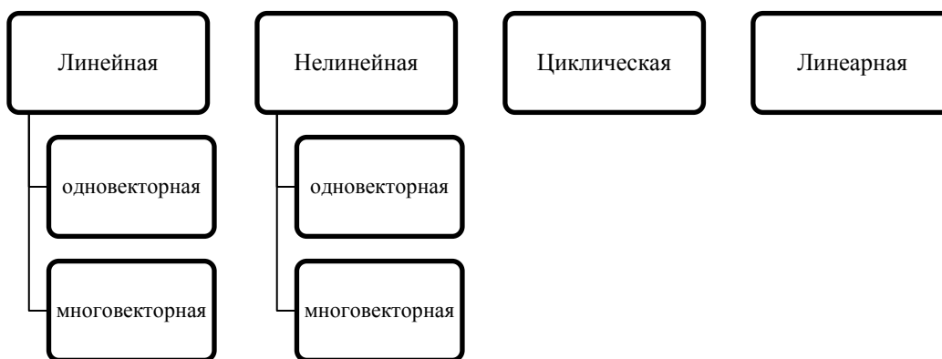
Рисунок 1. Типы темпоральных моделей

Приступая к исследованию специфики архитектоники номинативного поля художественного концепта ВРЕМЯ, прежде всего, подчеркнём, что в когнитивной сетке произведения существуют различные типы темпоральных моделей: «1) линейная, а именно (а) одновекторная, (б) многовекторная, 2) нелинейная, а именно (а) одновекторная, (б) многовекторная, 3) циклическая, 4) линейная» [12, с. 144], которые можно представить в виде схемы (см. Рис. 1).