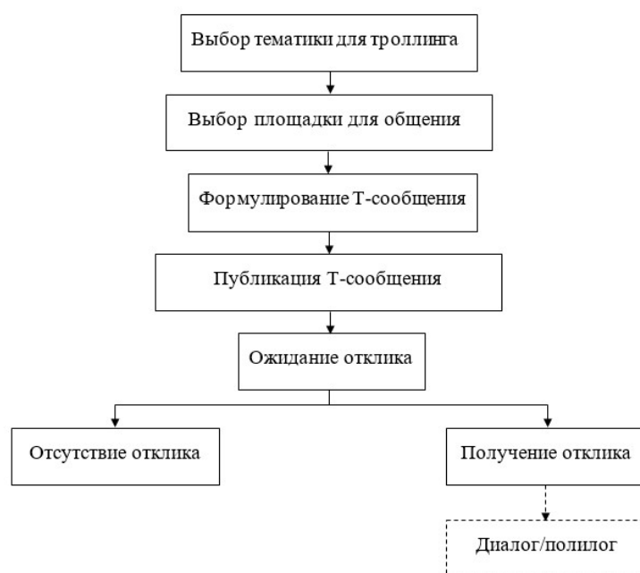
Рисунок 1. План троллинг-стратегии

Анализируя Т-стратегию, мы пришли к выводу, что она состоит из следующих этапов [2, с. 70] (см. Рисунок 1):