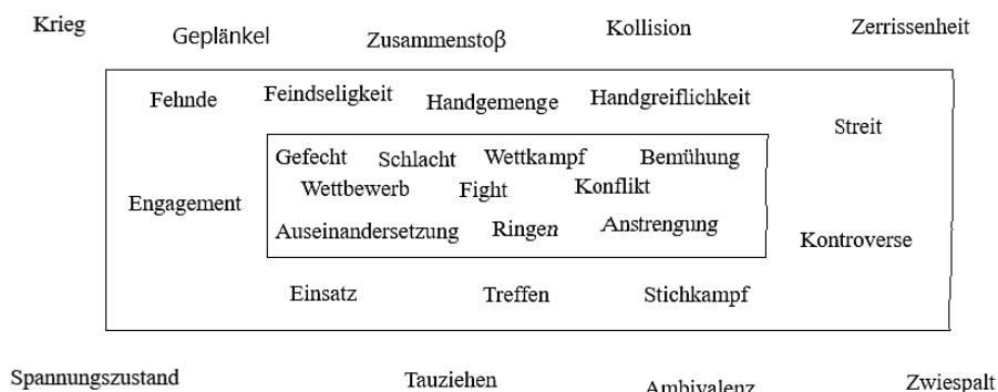
Рисунок 3. Полевая структура концепта КАМРФ

Дальняя периферия формируется на основании наличия сем: ТОТАЛЬНЫЙ ВОЕННЫЙ КОНФЛИКТ, КРУПНЫЙ МАСШТАБ, НЕЗНАЧИТЕЛЬНАЯ СТЫЧКА, ПЕРЕСТРЕЛКА, СЛУЧАЙНОЕ СТОЛКНОВЕНИЕ, КОНФЛИКТ, ВНУТРЕННИЙ РАЗЛАД, ПРОТИВОРЕЧИВЫЕ ЧУВСТВА, ЗАТЯЖНОЕ ПРОТИБОБОРСТВО, БОРЬБА ЗА ВЛИЯНИЕ, СОСТОЯНИЕ НАПРЯЖЕНИЯ ПЕРЕД БОРЬБОЙ.